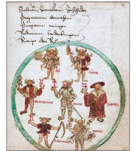
Sedm planet personifikovaných, 1543.

Začalo se hovořit o inteligenci rostlin a duševním životě zvířat. Vila-janur Rámačandran využil naši fraktální zodiakální strukturu těla (kterou známe z renesanční astromedicíny) na léčení fantomové končetiny. Uvě-