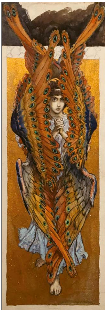
Viktor Michajlovič Vasněcov: Serafín, 1896.