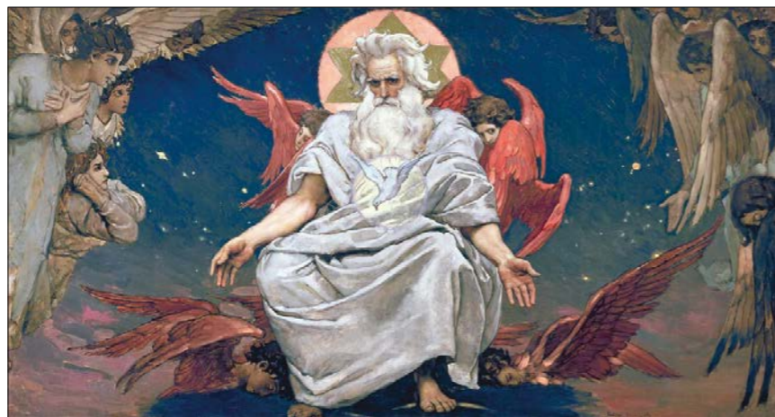
Viktor Michajlovič Vasněcov: Bůh všech světů, kolem 1890.

nosti a dívala se, co se jí zevnitř zjeví. Vše bylo potom analogické, příbuzné s člověkem; vše nabylo smyslu nadáno duševním významem. Svět byl hezký, útulný a člověk v něm byl doma. Příroda představovala člověka rozloženého na části a člověk byl souhrnem přírody, mikrokosmem. Zvířata, rostliny, minerály, ba i souhvězdí – vše vzniklo z člověka při mýtických proměnách. Vavřín je cudný, neboť je to proměněná dívka, která toužila zůstat pannou; vrba je smutná, protože ztratila někoho blízkého – to se vědělo od Středo-zemního moře až po japonské ostrovy.