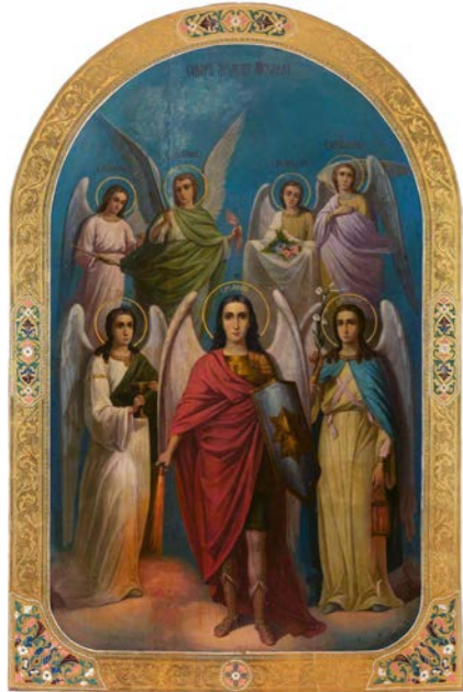
Sedm archandělů. Ruská ikona, kolem 1900.