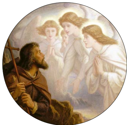
Joseph Noel Paton: Ved' mě, laskavé světlo, uprostřed soumraku, 1894.

telům, kteří hmotně i duševně podporovali celé dílo a trpělivě na něj čekali. Díky nim jsem se směl uvolnit pro mimořádnou práci a zároveň jsem ji měl pro koho dělat. Ať má kniha slouží spíše jen jako inspirující příklad způsobu, jak lze přistoupit k poznání v celistvém duchu, a méně jako už hotová nauka.