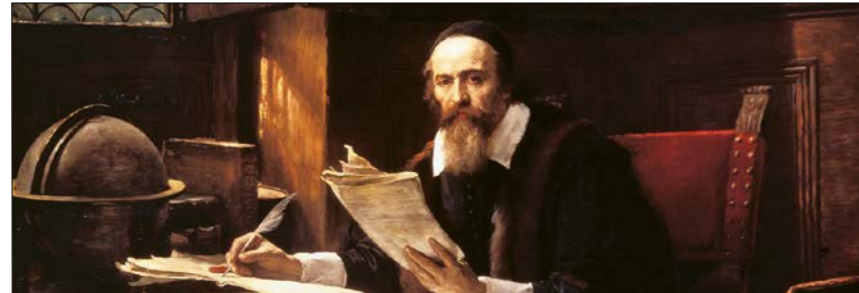
Jan Amos Komenský (1592-1670).

Naším cílem je poznat, kultivovat a zušlechtit tyto procesy, ze kterých se teprve rodí kognitivní styly a racionality různého typu. V celé práci nám jde hlavně o toto: ukazujeme, jak všechno vyrůstá z jemné pavučiny snů, přičemž sny se v konečném důsledku točí kolem hodnot. Svět jsou zhmotnělé hodnoty. Historické epochy vyvěrají z hlubokých posunů v žebříčku hodnot. Dominantní hodnota je osou, kolem níž se točí a formují všechny ostatní složky společnosti: vzniká určitý typ vědecké racionality, estetického citění, náboženství i politického zřízení.