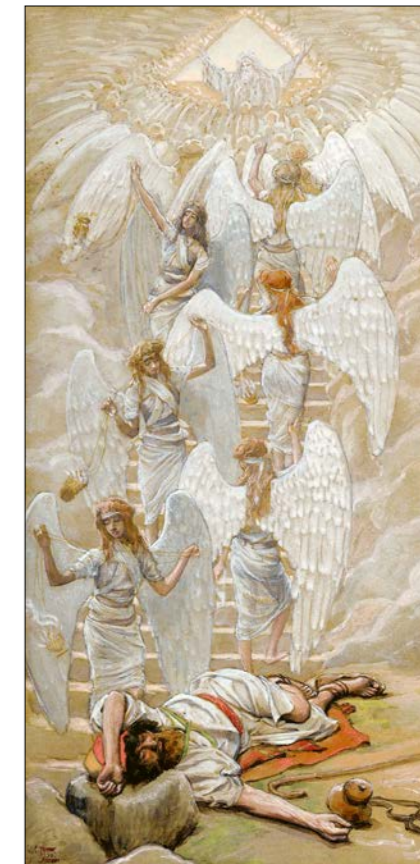
James Tissot: Jákobův sen, kolem 1899.

Na otázku, jaký má tedy angelologie vztah k vědě, můžeme odpovědět: zabývá se tím, co je předvědecké . Jednak historicky, co bylo před vznikem vědy, tedy oním předracionálním stupněm vědomí; a jednak psychologicky, intuicemi, jež předcházejí vědeckému objevu. Racionální testování hypotéz, které pokládáme za vědu, je totiž až závěrečnou fází každého objevu, jehož začátek leží ve snech, představivosti a intuitivních procesech svým charakterem příbuzných s nábožensko-uměleckou inspirací.