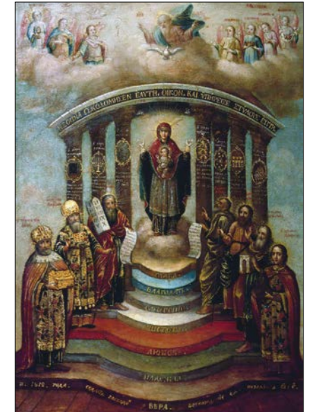
Sofia – Boží Moudrost se sedmi archanděly a sedmi starozákonními postavami. Jejich sedm sloupů jsou dary Svätého Ducha a předstupně tvoří sedm ctností. Pravoslavná ikona, 1812.

Archaická mysl pojímala vše z opačného konce, zevnitř. Poznávala věci tak, že vcítěním nechala rezonovat stejnorodou strunu ve vlastní přiroze-