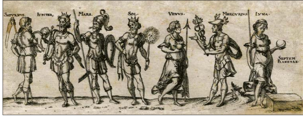
Sedm planet. Německý lept ze 17. stol.

rozvracející lidský imunitní systém. Do diskuse o axiální epoše přispíváme objasněním její periodičnosti, čímž se řeší sporná otázka o jejím časovém vymezení zaměstnávající učence už 250 let.