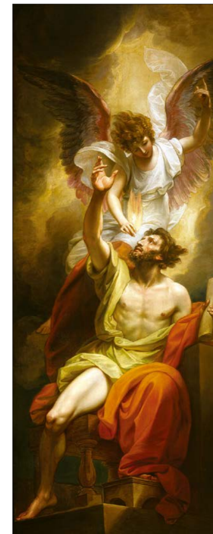
Benjamin West: Izajášovy rty posvěcené ohněm , 18. stol.