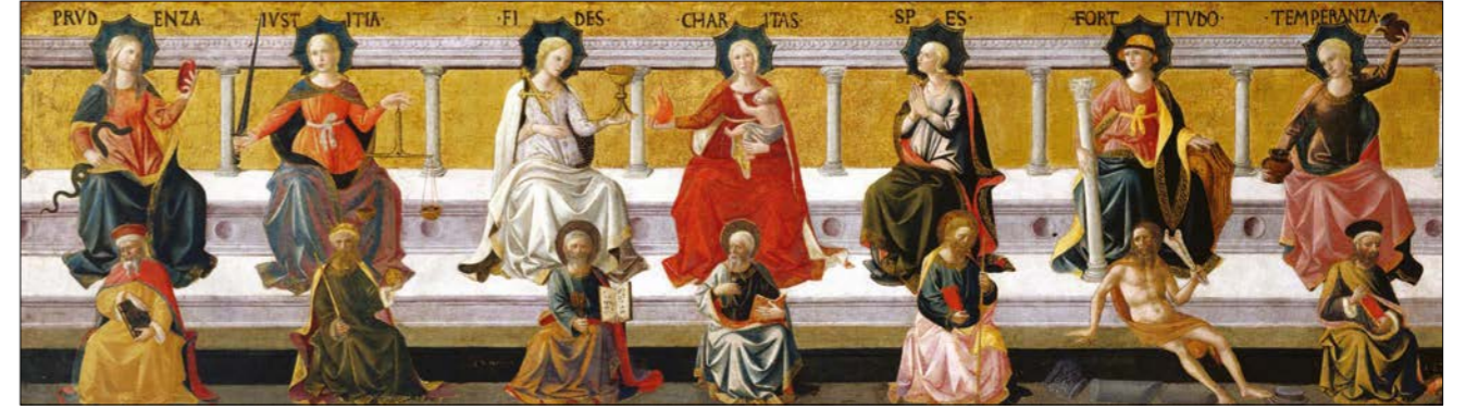
Francesco Peselli: Sedm ctností, kolem 1450.

Archandělé představují zdokonalené, ideální podoby sedmi základních sil duše a arcidémoni jejich pokřivené formy. Těchto sedm znamená pro duchovně psychologii tolik, co abeceda pro lingvistiku nebo periodická tabulka prvků pro chemii. Vzájemnou interakcí těchto sil se odehrává duševní alchymie, která dává směr našim osobním osudům i osudům národů. Nejjemnější síly jsou ty nejmocnější: přicházejí do duše jako sen nebo tichý šepot a nakonec mění hranice říší, jako by to bylo jen naváté listí.