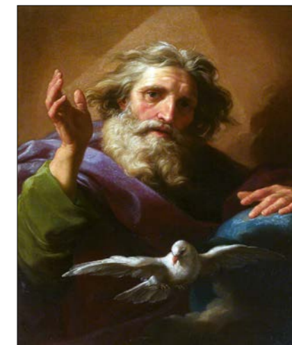
Pompeo Batoni: Bůh Otec a Svatý duch, 1740.

Na závěr chci ze srdce poděkovat všem čtenářům, posluchačům, žákům Školy angelologie a členům Kruhu sponzorů ; mým spolupracovníkům a přá-