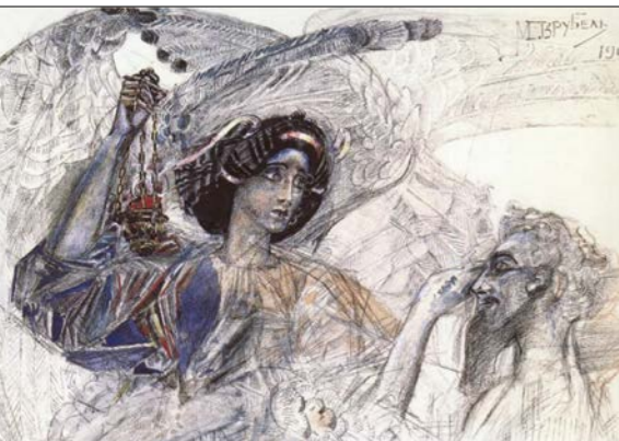
Michail Alexandrovič Vrubel: Šestikřídý serafín vkládá oheň do prorokova srdce, 1905.