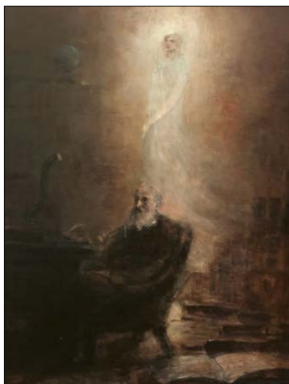
Eugeniu Voinescu: Zjevení, 19. stol.

domil si, že (chybějící) ruka se zrcadlí i v obličejí, na horní čelisti s jejím jařmovým obloukem.