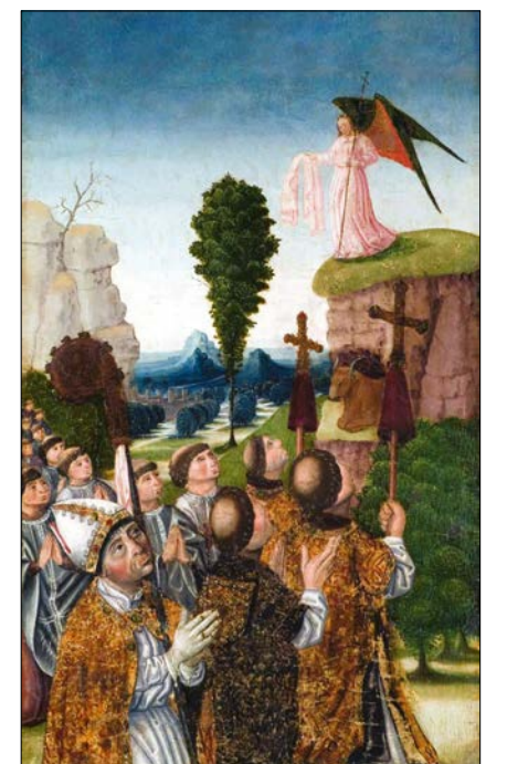
Zjavenie Michaela na hore Gargano, 15. stor.