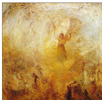
William Turner: Anjel stojaci v slnku, 1846.