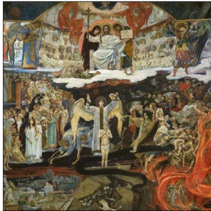
Viktor Michailovič Vasnevov: Posledný súd, 1904.

spočívajúcu v nevedomelom súlade s celkom stvorenia. Dejiny sa končia poslednou bitkou dobra a zla, prekonaním ich rozporu a návratom k celistvosti.