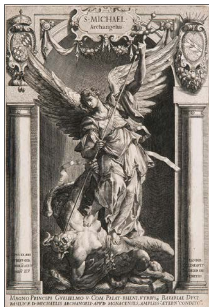
Archanjel Michael víťazí nad čertom, 1588.