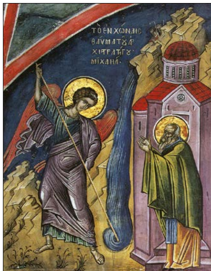
Michaelov zázrak pri Kolosách. Freska na hore Athos, 1546.