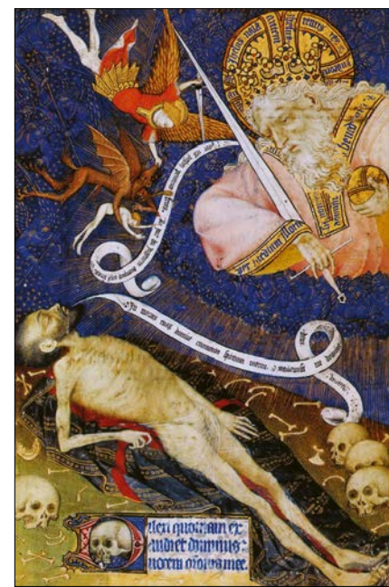
Michael zachraňuje dušu zomierajúceho z rúk diabla, 1430.

Michael je anjelom posledných vecí, kresťanským anjelom smrti . Smrť je malý súd. Pri zážitkoch na prahu smrti sa zmení plynutie času a za zlomok sekundy sa nám premietne náš život. Po prvýkrát ho uzieme vo svetle skutočných hodnôt, v jeho pravom význame. Tam, na prahu smrti nás čaká archanjel Slnka. Nie je to on, kto vynáša súd. Anjel smrti mlčí a díva sa, ako sa postavíme k pravde o sebe. Len tí, čo si počas života urobili vzťah k Michaelovi, to dokážu znieť a neprepadnú zúfalstvu. Len tí, čo v sebe rozžali iskierku duchovného Slnka, dokážu privolať Michaela, aby ich vytrhol z pazúrov