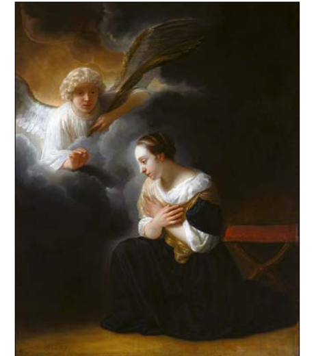
Samuel van Hoogstraten: Anjel s palmou zvestuje smrť panne Márii, 1670.

Každý národ má svojho strážneho ducha a u Daniela sa spomínajú aj anjelské kniežatá Peržanov a Grékov. Tu ide však o čosi viac. Michael nie je len národným duchom vlievajúcim osobitý charakter židovstvu, ale patrónom