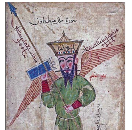
Archanjel Michael-Metatron na perzskej iluminácii zo 14. stor.