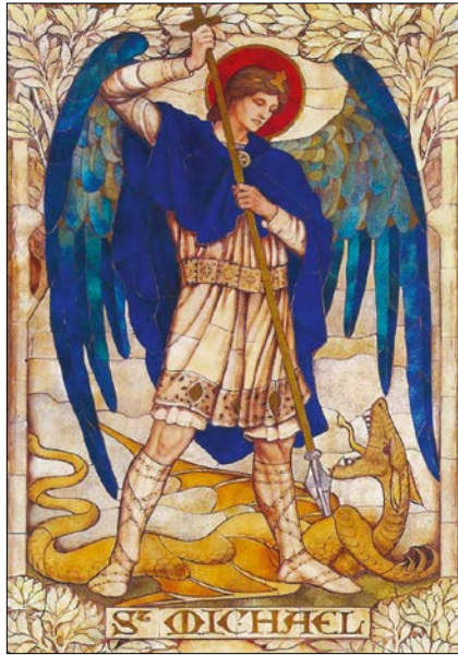
James Powell: Archanjel Michael, 1888.