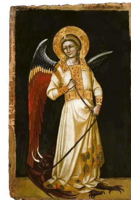
Guariento di Arpo: Anjel z chóru mocností drží na reťazi diabla, 1354.