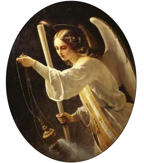
Carl Timoleon von Neff: Anjel s kadidelnicou, 19. stor.