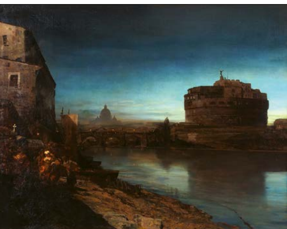
Oswald Achenbach: Anjelský hrad za súmraku, 1882.

nom tých, čo majú byť spasení. To je duchovný prúd, ktorý bol po istý čas činný v rámci dedičnej línie a prekryval sa s ňou. S Kristovým príchodom sa však odpútal od pokrvných zväzkov. Novým vyvoleným ľuďom sú pokrstení zo všetkých národov – tí, čo sa druhýkrát narodili z Ducha. Pred príchodom Krista Michael ochraňoval synagógu a po ňom ochraňuje cirkev. Kresťania zo všetkých národov ho vzývajú ako svojho patróna.