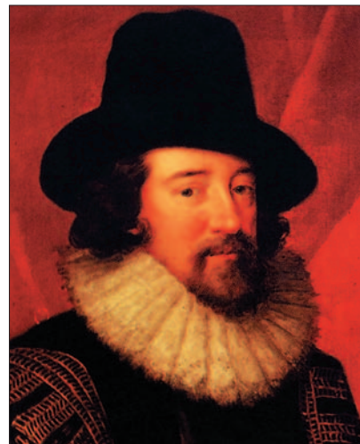
Francis Bacon (1561-1626).

Tento prúd našiel na konci gabrielského obdobia na jednej strane svoje dôsledné vyvrcholenie v dialektickom materializme Karola Marxa (1818-1883) a Friedricha Engelsa (1820-1895); na druhej strane pokračoval v pozitivizme. Východiskovou tézou zakladateľa „ pozitívnej filozofie “ Augusta Comta (1798-1857) „ je požiadavka, aby sa veda obmedzila na opis vonkajšej stránky javov. Opierajúc sa o túto tézu, tvrdil, že metafyziku, t.j. učenie o podstate javov, treba odstrániť “. 200 Metafyzická oblasť je pre Comta „ temná “, „ zmysluprázdna “, je to „ márne hovorenie o entitách, ktoré sa nedajú vnímať “.