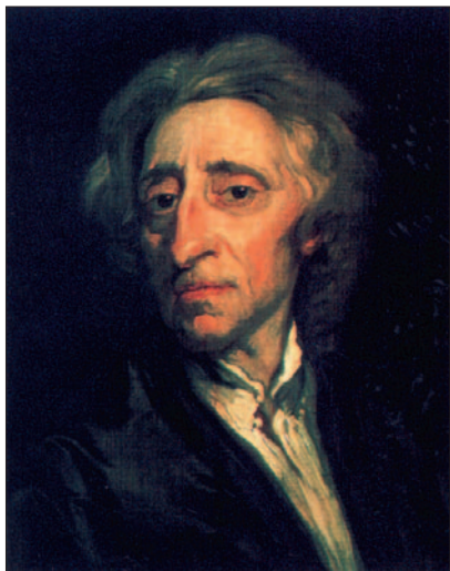
John Locke (1632-1704).

„Odmietnutie odvolávať sa na čokoľvek, čo sa nedá jednoznačne vnímať, vyznačuje dosiahnutie pozitívneho - a najvyššieho - štádia ľudského myslenia.“ 208 Comtova predstava o dejinách ľudského myslenia, ktoré majú vyvrcholiť myslením len o tom, čo sa dá „pozitívne“ vnímať, je len absolutizáciou gabrielského impulzu, zovšeobecnením momentálnej atmosféry doby. Comte si nevšima, že impulzy k materialistickému a idealistickému mysleniu sa v dejinách pravidelne striedajú.