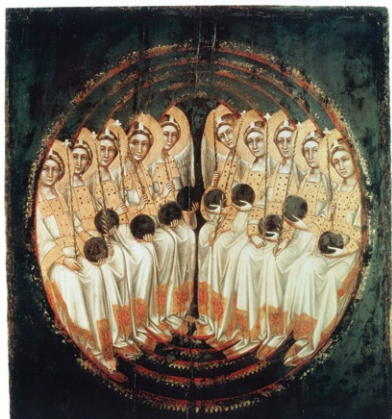
Guariento di Arpo: Chór Panstev, 1345.

Další vědeckou oblastí, jež se utápí ve zmatcích, je vývojová biologie. Darwinismus není vědeckou teorií, nýbrž monománií, fixní ideou, do níž lze skutečnost vtěsnat pouze násilím, za cenu neřešitelných kontradikcí a zkreslování údajů. Jakékoli inovace v dějinách Země – řekněme vznik vnější kostry korýšů, páteře u obratlovců, prvních kvetoucích rostlin, oční čočky, parohů nebo ptačích per – by se z hlediska darwinismu mohly objevit v libovolné době, ale vždy jen v určitém prostředí, jako výsledek přizpůsobení v boji o přežití. Ve skutečnosti však vznikají