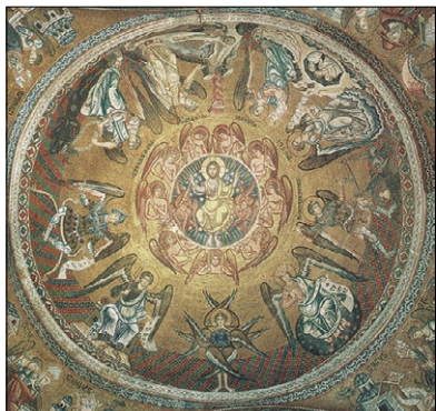
Devět andělských chórů a jejich charakteristické činnosti. Kupole v katedrále sv. Marka, Benátky, 13. stol.

stropech kostelů (například v kostele sv. Marka v Benátkách či sv. Sofie v Kyjevě) bývalo vyobrazeno všech devět chórů i s jejich příslušným posláním. První a zároveň nejvyšší úroveň představují Serafíni, Cherubíni a Trůny. Ti stvořili nebeská tělesa a hmotě vtiskli struktury, které dnes objevujeme jako fyzikální a chemické zákony. Panstva, Síly a Mocnosti tvoří druhou úroveň. Jsou inteligencí rostlinné a živočišné říše. Vývoj forem živé přírody je vlastně myšlením andělů druhé úrovně. Třetí a nejnižší úroveň představují Knížectva, Archandělé a Andělé. Nejznámějším posláním Andělů je být duchovními ochránci člověka. Archandělé inspirují dějinné a kulturní epochy. Vlivem Knížectví se formují a jsou vedeny národy či etnické skupiny. Třetí úroveň andělů tedy inspiruje kulturu, a odrazem její činnosti jsou dějiny.