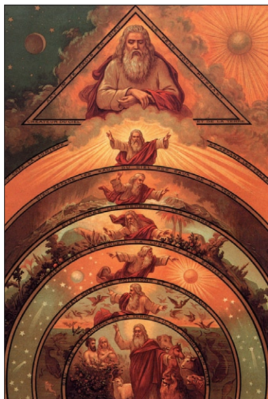
Sedm dní stvoření, 19. stol.

Zeptejte se, řekněme, na archanděla Gabriela – kolik lidí, tolik názorů. Skutečný angelolog nezačíná autosugescí, ale nesobeckou službou světu, obětí. Ta ho zviditelní v očích duchovních bytostí a připraví na přijetí pravé inspirace. A svou vnitřní vizi si prověřuje na zkušebním kameni praktické reality, aby ji očistil od sebeklamů. Pravé duchovní poznání nám musí poskytnout účinnou schopnost porozumět přírodě, dějinám a člověku, neboť se jím spojujeme s tvůrčími inteligencemi, jež podmiňují evoluci, světové dění a lidské osudy. Přítomnost těchto bytostí však nelze koupit, vyprosit ani vynutit. Zjeví se tomu, komu chtějí a kdo si to zaslouží.