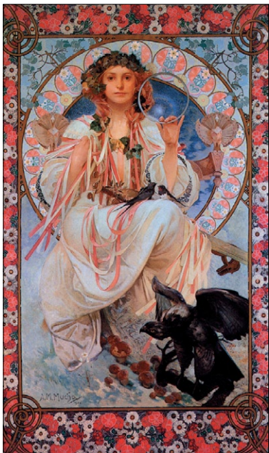
Alfons Mucha: Slávia , 1908.

v různých prostředích (na souši, ve vzduchu i pod hladinou moře), ale jen v určité době. Objevují se současně u celé řady druhů, u nichž nedochází ke vzájemnému genetickému křížení.