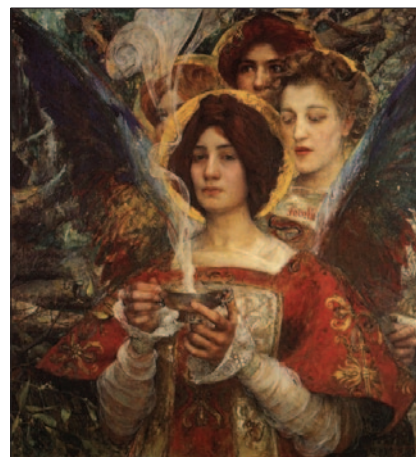
Edgard Maxence: Duch lesa, 1898.