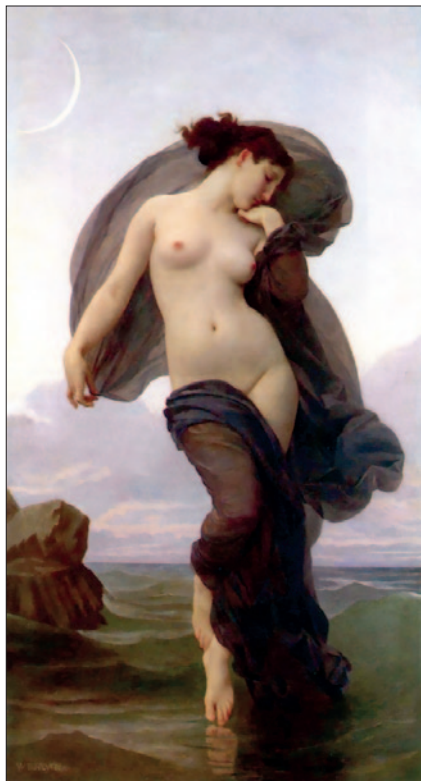
William Adolphe Bouguereau: Večerní nálada , 1882.