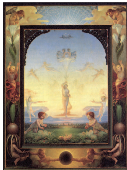
Otto Runge: Jitro, 1808.