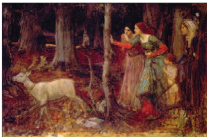
John William Waterhouse: Magický les , 1914-17.

(3) Středověká islámská a židovská filosofie. Filosofie renesance a reformace.