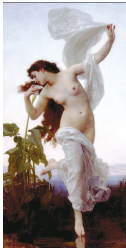
William Adolphe Bouguereau: Svítání , 1881.