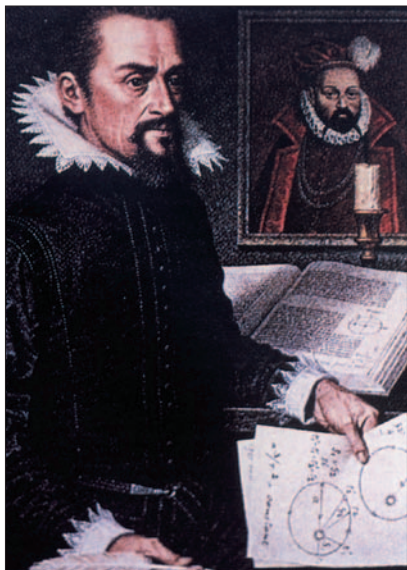
Jean-Leon Huens: Johannes Kepler. Na stene visí obraz Tycha de Brahe.

Harriott, Scheiner a Fabricius slnečné škvrnny. Okolnosť, ktorá tomu predchádzala, je zjavná: je ňou objav ďalekohľadu v roku 1609. Samotný ďalekohľad si nárokovali traja objavitelia: Jansen, Lippershey a Metius. Všetci traja boli Holanďania. Holandsko bolo v tom čase krajinou, ktorá viedla v brúsení šošoviek.