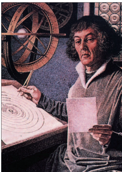
Jean-Leon Huens: Mikuláš Kopernik.

rastlinný druh, vidíme jednotu, súlad vo všetkých jeho častiach. Jednotlivé časti rastliny - stonka, list, kvet, plod, semeno - nie sú hocijaké, ale hodia sa k sebe navzájom, sú sformované podľa jednotného estetického princípu. Predstavte si dubové lístie na krehkej breze alebo ľaliový kvet na ruži - každému by hneď udrelo do oka, že k sebe nepatria. Tak aj každá historická kultúra alebo doba akoby pili z nejakého skrytého prameňa, ktorý dáva všetkým jej vrstvám určitú jednoliatosť, príbuznosť.