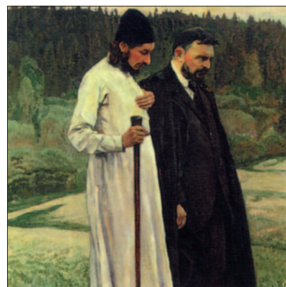
Pavel Florenskij (1882-1937) a Sergej Bulgakov (1871-1944).