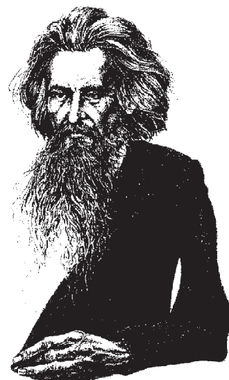
Vladimír Soloviov (1853-1900).

Zdokonalený zmysel pre krásno sa Slovanom premieňa na orgán poznania. Bola to krása liturgických obradov v chráme sv. Sofie v Carihrade, ktorá podľa Nestorovej kroniky presvedčila slovanských poslov o pravdivosti kresťanstva. Pravoslávny východ považuje maľby na ikonách za „pravdi-