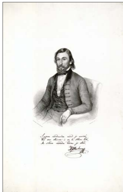
Jozef Miloslav Hurban (1817-88).

Jadrom sofiológie je úsilie o syntézu troch prameňov poznania – zmyslov, rozumu a intuície. Tieto tri schopnosti berie ako relatívne nezávislé a rovnocenné rozmery, ktoré je potrebné sklbiť. Všetky tri – vedecké pozoro-