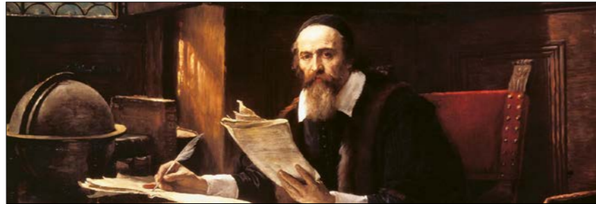
Jan Amos Komenský (1592-1670).

Naším cieľom je spoznať, kultivovať a zušľachtiť tieto procesy, z ktorých sa ešte len rodia kognitívne štýly a racionality rôzneho typu. V celej práci nám ide hlavne o toto: ukazujeme, ako všetko vyrastá z jemnej pavučiny snov, pričom sny sa v konečnom dôsledku točia okolo hodnôt. Svet sú zhmotnené hodnoty. Historické epochy vyvierajú z hlbokých posunov v rebríčku hodnôt. Dominantná hodnota je osou, okolo ktorej sa točia a formujú všetky ostatné zložky spoločnosti: vzniká určitý typ vedeckej racionality, estetického cítenia, náboženstva aj politického zriadenia.