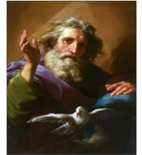
Pompeo Batoni: Boh Otec a Svätý duch, 1740.

Na záver chcem zo srdca poďakovať všetkým čitateľom, poslucháčom, žiakom Školy angelológie a členom Kruhu sponzorov ; mojim spolupracovníkom a priateľom, ktorí hmotne i duševne podporovali celé dielo a trpezlivo