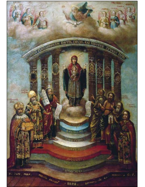
Sofia – Božia Múdrosť so siedmimi archanjelmi a siedmimi starozákonnými postavami. Jej sedem stĺpov sú dary Svätého Ducha a predstupne tvorí sedem cností. Pravoslávna ikona, 1812.

Archaická myseľ ponímala všetko z opačného konca, zvnútra. Poznávala veci tak, že vcítením nechala rezonovať rovnorodú strunu vo vlastnej priro-