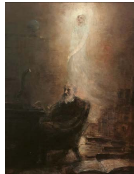
Eugeniu Voinescu: Zjavenie, 19. stor.