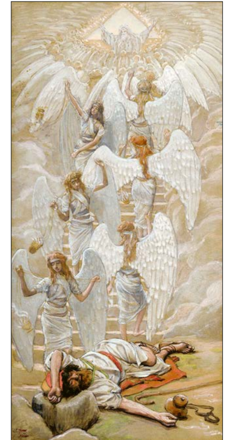
James Tissot: Jákobov sen, okolo 1899.

Na otázku, aký má teda angelológia vzťah k vede, môžeme odpovedať: zaoberá sa tým, čo je predvedecké . Jednak historicky, čo bolo pred vznikom vedy, teda oným predracionálnym stupňom vedomia; a jednak psychologicky, intuíciami, ktoré predchádzajú vedeckému objavu. Racionálne testovanie hypotéz, ktoré pokladáme za vedu, je totiž až záverečnou fázou každého objavu, ktorého začiatok leží v snoch, predstavivosti a intuitívnych procesoch svojím charakterom príbuzných s nábožensko-umeleckou inšpiráciou.