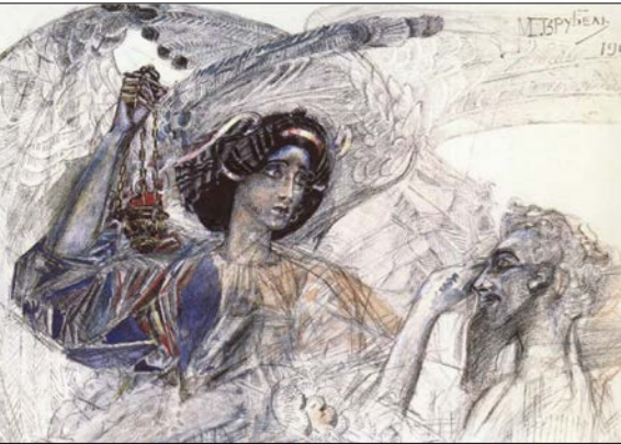
Michail Alexandrovič Vrubel: Šestkrídly serafín vkladá oheň do prorokovho srdca, 1905.

Uvedomil si, že (chýbajúca) ruka sa zrkadlí aj na tvári, na hornej čelusti s jej jarmovým oblúkom.