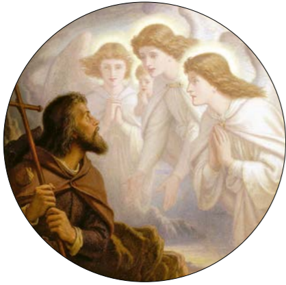
Joseph Noel Paton: Ved' ma, láskavé svetlo, uprostred súmraku, 1894.

naň čakali. Vďaka nim som sa smel uvoľniť pre mimoriadnu prácu a zároveň som ju mal pre koho robiť. Nech moja kniha slúži skôr len ako inšpirujúci príklad spôsobu, ako sa dá pristúpiť k poznaniu v celistvom duchu, a menej ako už hotová náuka.