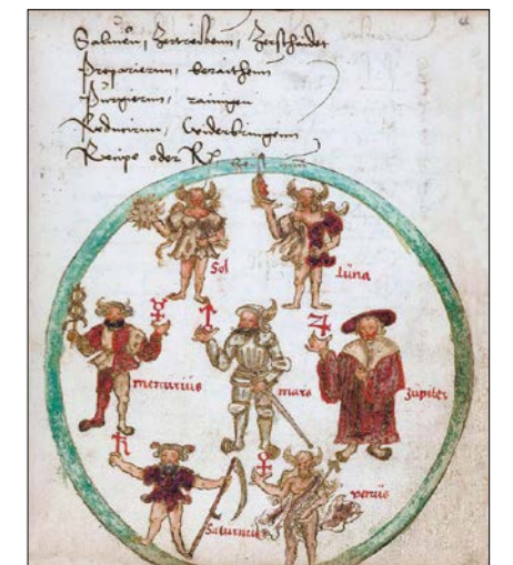
Sedem planét personifikovaných, 1543.

Začalo sa hovoriť o inteligencii rastlín a duševnom živote zvierat. Vila-janur Ramačandran využil našu fraktálnu zodiakálnu štruktúru tela (ktorú máme z renesančnej astromedicíny) na liečenie fantómovej končatiny.