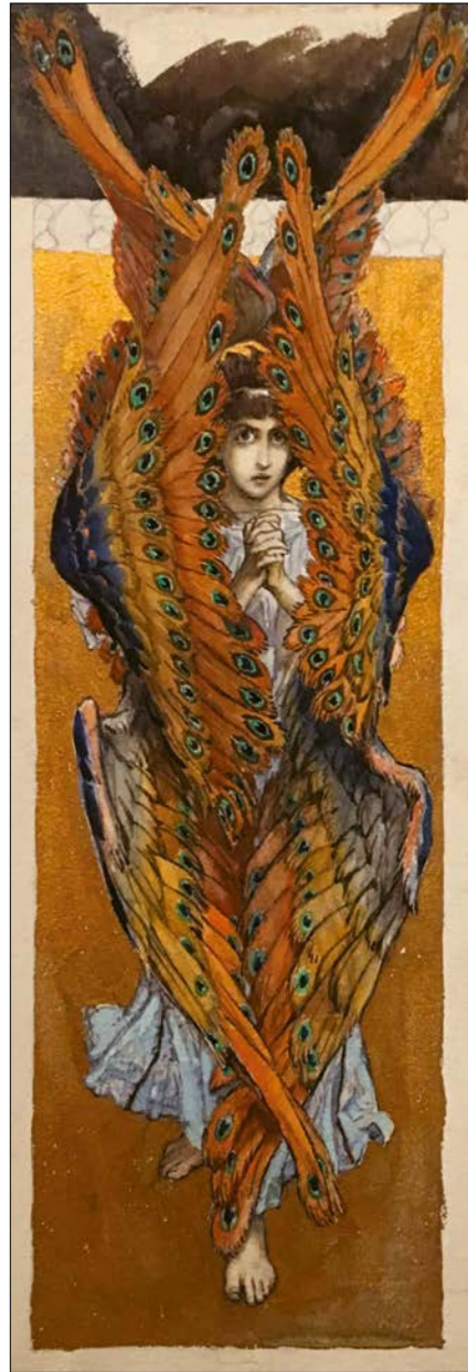
Viktor Michailovič Vasnecov: Serafín, 1896.