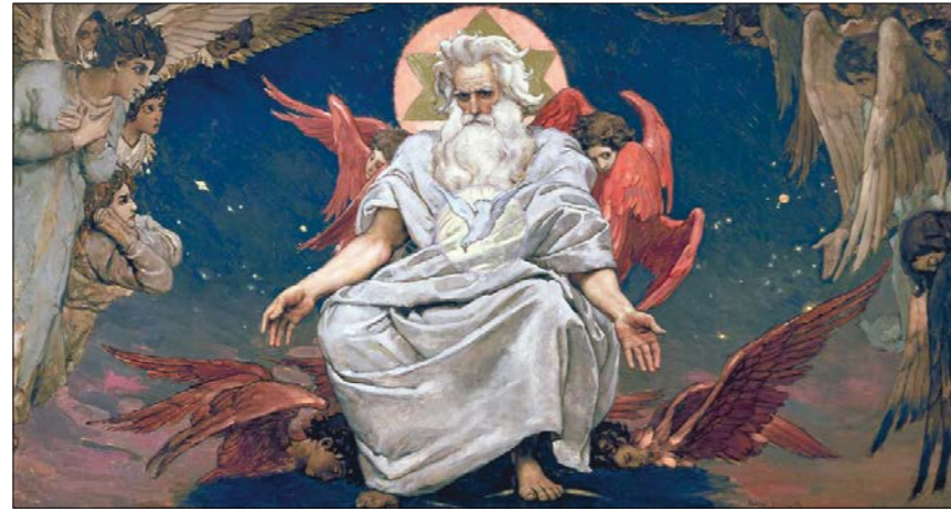
Viktor Michailovič Vasnecov: Boh všetkých svetov, okolo 1890.

dzenosti a dívala sa, čo sa jej zvnútra zjaví. Všetko bolo potom analogické, príbuzné s človekom; všetko ozmyslené duševným významom. Svet bol pekný, útulný a človek v ňom bol doma. Príroda predstavovala človeka rozloženého na časti a človek bol súhrnom prírody, mikrokozmom. Zvieratá, rastliny, minerály, ba aj súhvezdia – všetko vzniklo z človeka pri mýtických premenách. Vavrín je cudný, lebo je to premenená dievčina, ktorá túžila zostať pannou; vřba je smutná, pretože stratila niekoho blízkeho – to sa vedelo od Stredozemného mora až po japonské ostrovy.