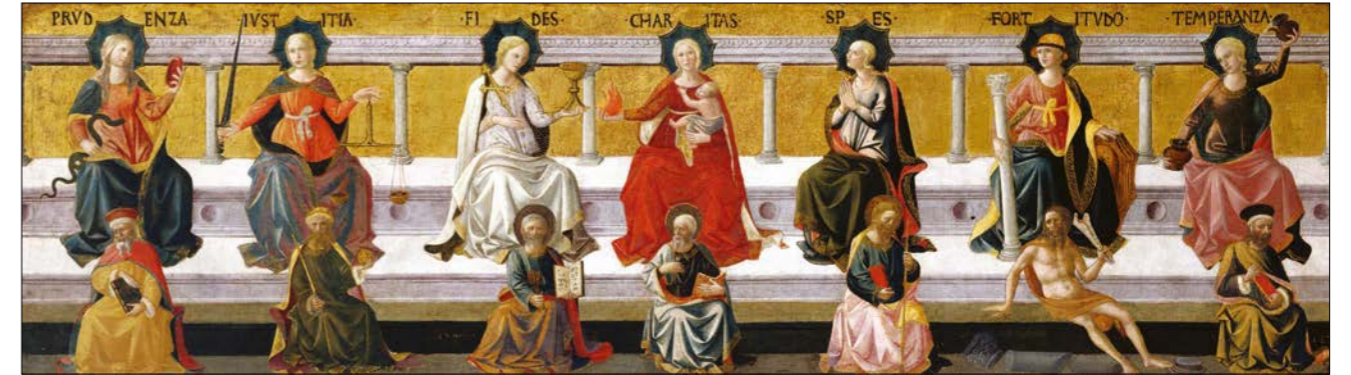
Francesco Peselli: Sedem cností, okolo 1450.

Archanjeli predstavujú zdokonalené, ideálne podoby siedmich základných síl duše a arcidémoni ich pokrivené formy. Týchto sedem znamená pre duchovnú psychológiu toľko, čo abeceda pre lingvistiku alebo periodická tabuľka prvkov pre chémiu. Vzájomnou interakciou týchto síl sa odohráva duševná alchymia, ktorá dáva smer našim osobným osudom aj osudom národov. Najjemnejšie sily sú tie najmocnejšie: prichádzajú do duše ako sen alebo tichý šepot a nakoniec menia hranice ríš, akoby to bolo len naviate lístie.