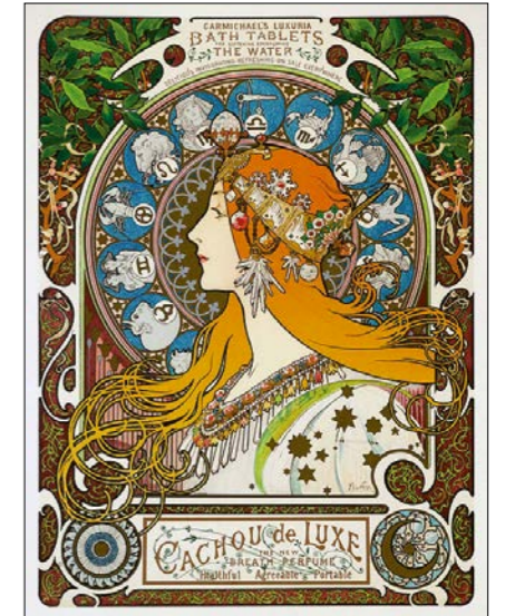
Alfons Mucha: Zvěrokruh, 1896.

Je Australan, který se narodí na Vánoce (tedy v létě) ve skutečnosti Kozo-