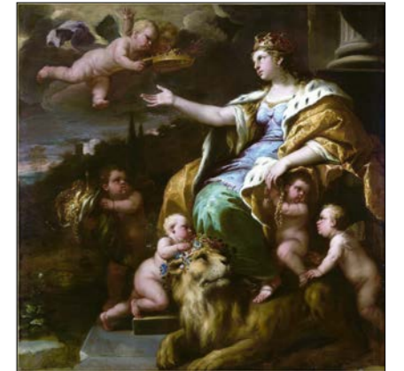
Luca Giordano: Alegorie velkodušnosti, 1670.

Klíčovými slunečními slovy jsou seberealizace, individuace, integrita