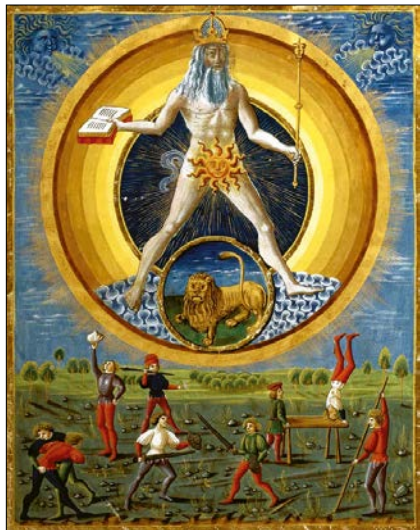
Deti Slnka. Taliansky rukopis z roku 1470.

Slnko v ročnom kolobehu nie je rovnaké: zimné, jarné či jesenné slnko nám posiela iné lúče a vzbudzuje iné nálady. Vodnárske, býčie, škorpiónske slnko sa líšia – Slnko je vždy podfarbené znamením, v ktorom stojí. Podľa astrológov preto postavenie Slnka pri narodení dáva poznať náš osobný svojráz. Je to ten najpopulárnejší prvok z astrológie – každý vie povedať svoje slnečné znamenie.