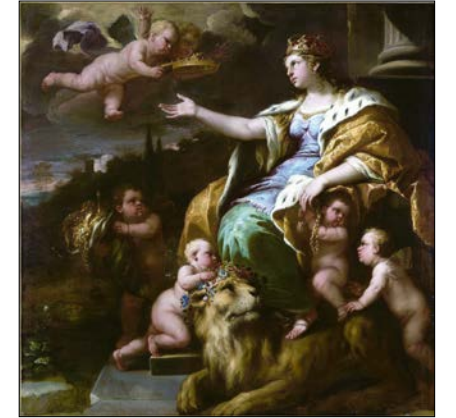
Luca Giordano: Alegória veľkodušnosti, 1670.

Kľúčové slnečné slová sú sebarealizácia, individuácia, integrita osobnosti .