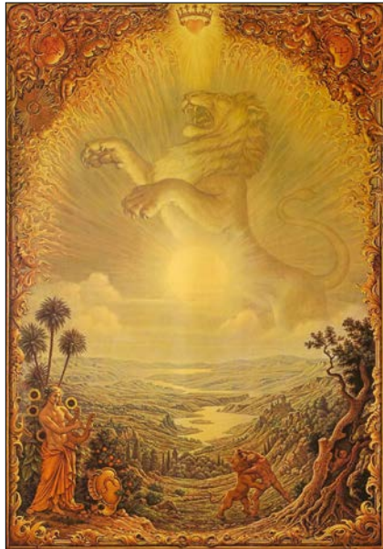
Johfra Bosschart: Znamenie Leva, 1974.