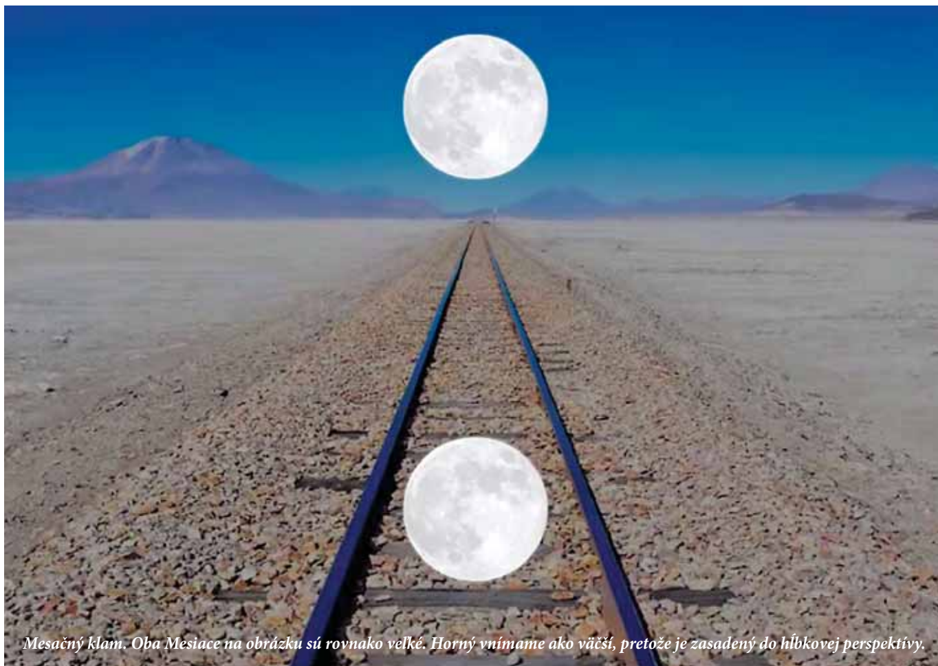
Mesačný kľam. Oba Mesiace na obrázku sú rovnako veľké. Horný vnímame ako väčší, pretože je zasadený do hĺbkovej perspektívy.

Každý nezaujatý divák videl, že v priebehu zápasu medzi hráčov vošla veľká čierna gorila, zastavila sa uprostred, búchala sa seba vedome do prs a pomaly prešla na druhý koniec ihriska. No diváci, ktorí dostali za úlohu spočítať prihrávky medzi hráčmi v bielych dresoch, nič nevideli.