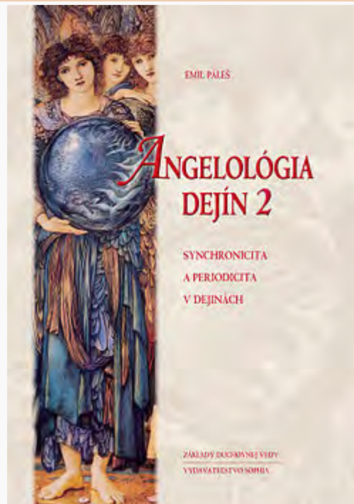
Prebal druhého zväzku Angelológie dejín, 2012