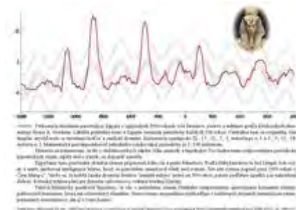
Pät'storočný rytmus lability politickej moci v Egypte. Graf zo série článkov ocenených cenou Zdeňka Kleina.