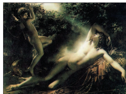
Anne-Louis Girodet de Roucy-Trioson: Spiaci Endymion , 1793.

Dnešná religionistika nie je v stave ani definovať mýtus. Mýtus je pre ňu ľubovoľné posvätné rozprávanie, trebárs aj vymyslené. Pravý mýtus zobrazuje nadmyslové, ale reálne deje! To podstatné na ňom je to, že si ho nevymysleli ľudia. Materialistická religionistika nedokáže rozlíšiť medzi mýtom a obyčajnou fantáziou, práve tak ako psychológia nie je v stave definovať, aký je rozdiel medzi zdravým náboženským zážitkom a patologickým sebaklamom a halucináciou. Vnímanie duchovných bytostí sa jej musí javiť rovnako ako psychóza. Pravá náboženská skúsenosť, z akej vzišli aj mýty, sa od fantázie líši tým, že sa vzťahuje k duchovným skutočnostiam nezávislým od nášho vedomia; k princípom, ktoré reálne pôsobia ako tvorivé sily vonku vo svete.