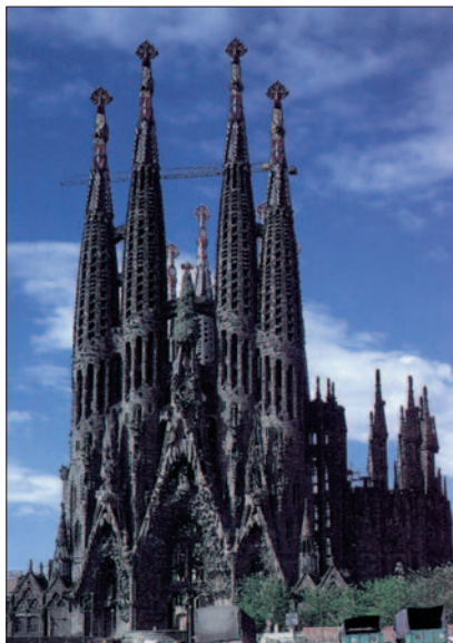
Antonio Gaudí: La Sagrada Familia .

a sa usiluje. Je zameraná na čas, nekonečno, prekračovanie hraníc, energiu, zápas, napätie, na všetko dynamické a bezhraničné. Smeruje k najvzdialenejšiemu a najvyššiemu. Politicky je jej nosičom národný štát namiesto mestského štátu. Tento nie je zviazaný s miestom, ale s dynastiou, ktorá mu dáva kontinuitu v čase. Peňažníctvo vyvinulo kredit a podvojnú účtovníctvo, ktoré obsahujú faktor času. Mincovníctvo je podľa Spenglera v západnej kultúre iba prežitok, dedičstvo klasickej kultúry. V umeniach dominuje maľba a hudba nad sochárstvom. V maľbe je to perspektíva s jej úbežným bodom, tieň, atmosféra; hudba vyvinula polyfóniu a kontrapunkt. V architektúre gotické katedrály kontrastujú s gréckymi chrámami svojou ašpiráciou a hľadaním. Matematika vyvinula infinitezimálny počet, fluxie, fluenty a limity; analytickú geometriu (geometriu premenenú na algebru) a pojem funkcie. Statická fyzika sa rozšírila o dynamiku, zrýchlenie a zaoberá sa časovými veličinami. Astronómia sa zmenila z geocentizmu, zakotveného teraz a tu, na heliocentizmus a prešla k predstave bezhraničného vesmíru. Vzniká skutočný dejepis s časovou hĺbkou a všetko sa chápe vo vývoji.