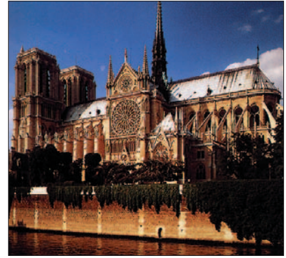
Katedrála Notre Dame v Paríži, 12. stor.

„ Horizontálne členenie stien, pevne zakotvených v hmote terás, prelamané zábradlie, rytmické členenie pilierov, postupné zvyšovanie vežíčiek smerom k hlavnej veži s cellou, do ktorej môže vstúpiť len najvyšší kňaz, vrstvenie vežíčiek podobných plameňom šľahajúcim okolo hlavnej veže, to všetko je naozaj výnimočné... Pre-