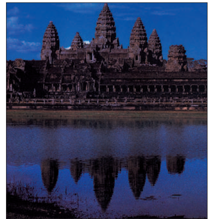
Angkor Vat v Kambodži, 12. stor.

PO PREHLIADKE CHRÁMU V CHARTRES POVEDAL CH. PÉQUY: KTO TOTO VYTVORIL, TEN MUSEL MAŤ PRAVDU. A STAL SA KREŠŤANOM.