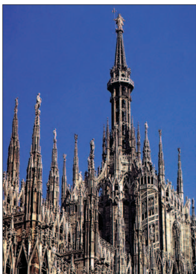
Plamienková gotika. Dóm v Miláne, 14.-15. stor.