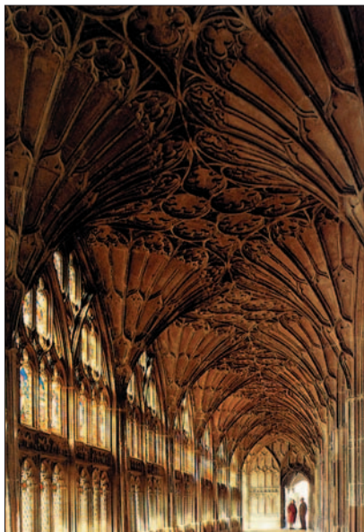
Plamienková gotika. Katedrála v Gloucestri, 14. stor.