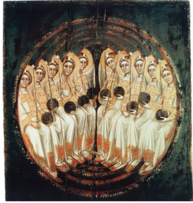
Guariento di Arpo: Chór Panstiev, 1345.

o druhom hlásali rovnaké hlavné myšlienky. Ako je to možné? Mudrci tej doby vypovedajú jednohlasne: zjavila sa im duchovná inteligencia Slnka (pod rôznymi menami ako Michael, Apollón, Ahura Mazda). Vskutku: v roku 600 pr. Kr. sa veľkým duchom času stal archanjel Slnka, Michael, inšpirátor filozofie! Čo nasledovalo, bol najväčší vek filozofickej tvorby v dejinách vôbec. A ďalšie, menšie kulminácie svetovej filozofie sa zhodujú s malými michaelskými obdobiami okolo roku 300, 800, 1300.