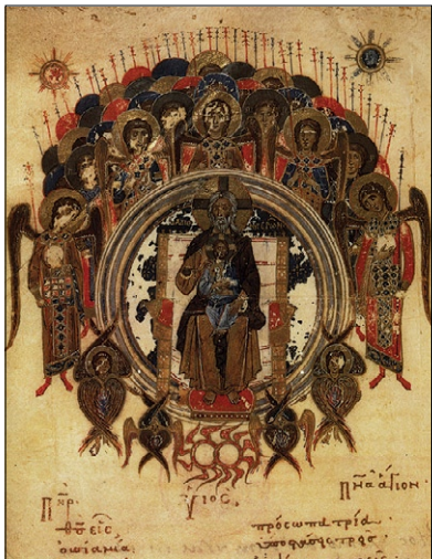
Boh otec ako Starec dní obklopený anjelskými chórmí. Grécka ilustrácia z 12. stor.

Jedným z takých javov je tvorivosť . Psychológia ju nedokáže ani definovať, tobôž odkryť jej pramene. Kultúrna antropológia a sociológia celkom zlyhali v snahe vysvetliť tvorivé vrcholy v dejinách. Je dávno známym javom, že géniovia sa v dejinách nevyskytujú rovnomerne roztrúsení na časovej osi, ale prichádzajú v celých zhlukoch – v „súhvezdiach“. Spomeňme si len na veľkých hudobných skladateľov nahromadených okolo roku