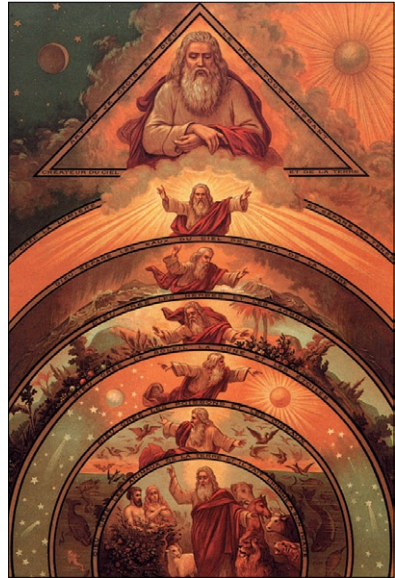
Sedem dní stvorenia, 19. stor.

Spýtajte sa povedzme na archanjela Gabriela – koľko ľudí, toľko názorov. Ozajstný angelológ nezačína autosugesciou, ale nesebeckou službou svetu, obeťou. Tá ho zviditeľní v očiach duchovných bytostí a pripraví na prijatie pravej inšpirácie. A svoju vnútornú víziu si preveruje na skúšobnom kameni praktickej reality, aby ju očistil od sebaklamov. Právé duchovné poznanie nám musí dať účinnú schopnosť porozumieť prírode, dejinám a človeku, pretože sa ním spájame s tvorivými inteligenciami, ktoré stoja za evolúciou, svetovým dianím a ľudskými osudmi. Prítomnosť týchto bytostí sa však nedá kúpiť, vyobrať ani vynútiť. Zjavia sa tomu, komu samy chcú a kto si to zaslúži.