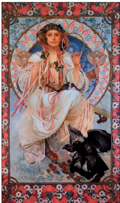
Alfons Mucha: Slávia , 1908.

neriešiteľných protirečení a skresľovania údajov. Akékoľvek inovácie v dejinách Zeme – povedzme vznik vonkajšej kostry kôrovcov, chrbtice stavovcov, prvých kvitnúcich rastlín, šošovkového oka, parohov alebo vtáčích pier – by sa podľa darwinizmu mohli objaviť v ľubovoľnom čase, ale vždy len v určitom prostredí, ako výsledok prispôsobenia sa kvôli prežitiu. V skutočnosti vznikajú v rôznych prostrediach (na súši, vo vzduchu aj pod hladinou mora), ale len v istom čase. Objavujú sa súčasne u celého radu druhov, ktoré sa medzi sebou dedične nekrížia.