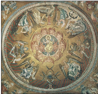
Deväť anjelských chórov a ich charakteristické činnosti. Kupola v katedrále sv. Marka, Benátky, 13. stor.

troch hierarchií, každú z nich po troch chóroch. Na stropoch kostolov (napríklad sv. Marka v Benátkach či sv. Sofie v Kyjeve) bývalo zobrazovaných všetkých deväť chórov aj s ich charakteristickými úlohami. Prvú a najvyššiu hierarchiu tvoria serafíni, cherubíni a tróny. Stvorili nebeské telesá a látke vpečatili štruktúry, ktoré dnes objavujeme ako fyzikálne a chemické zákony. Panstvá, sily a mocnosti tvoria druhú hierarchiu. Sú inteligenciami rastlinnej a zvieracej ríše. Vývoj foriem živj prírody sú vlastne myšlienky druhej hierarchie. Tretiu a najnižšiu hierarchiu tvoria kniežatstvá, archanjeli a anjeli. Najznámejšou úlohou anjelov je byť strážnymi duchmi ľudí. Archanjeli inšpirujú dejinné a kultúrne epochy. A vplyvom kniežatstiev sa formujú a vedú národy či etnické skupiny. Tretia hierarchia teda inšpiruje kultúru a odrazom jej činnosti sú dejiny.